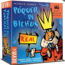
Póquer de bichos REAL