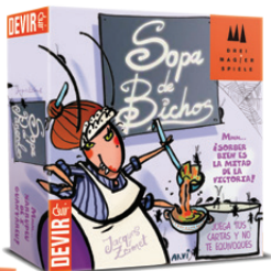
Sopa de bichos